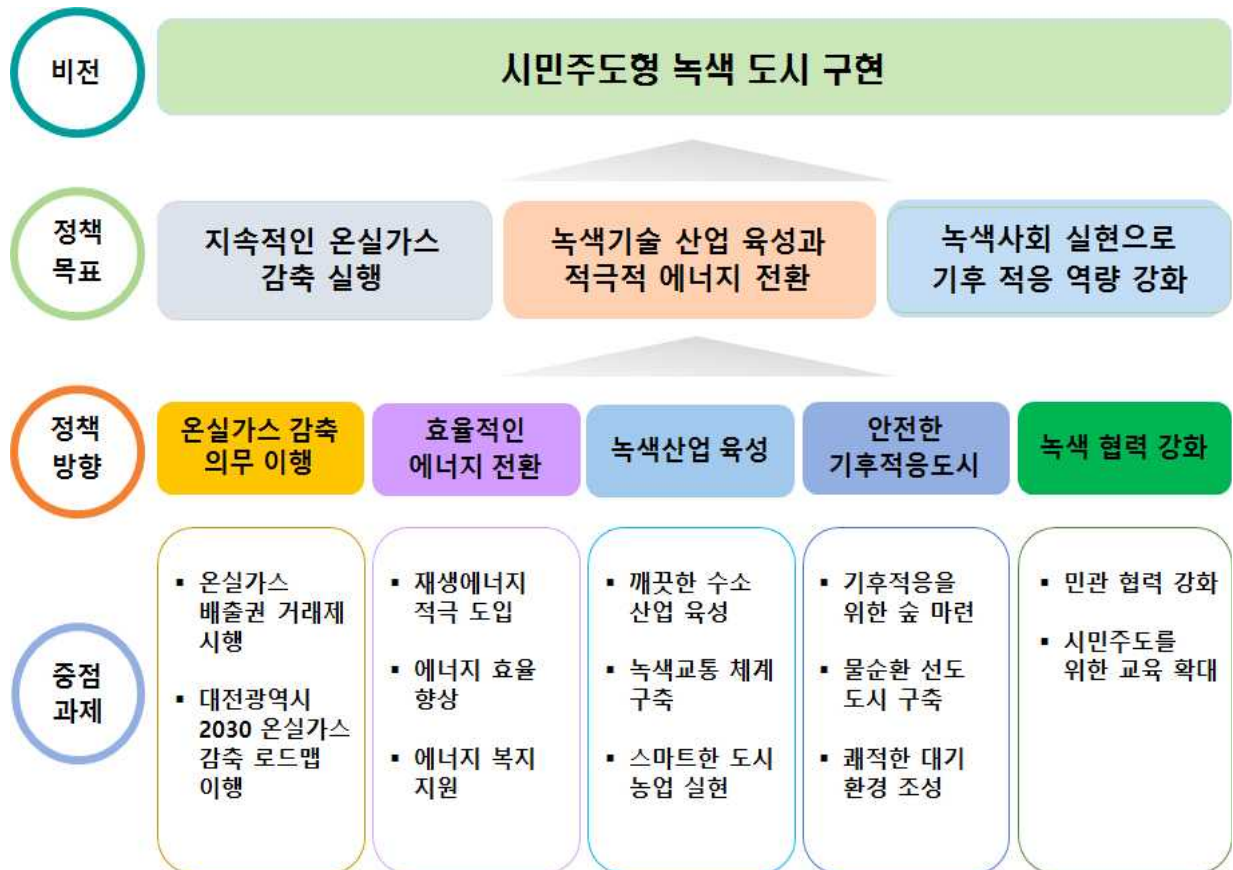
대전광역시 제3차 녹색성장 추진 계획 비전 및 체계